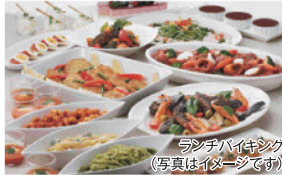
ランチバイキング (写真はイメージです)

☎11:30~14:00 席90席※個室有(15名様まで) 現金、カード(ダイナース、JCB、DC、VISA、UC、UFJ、AMEX、銀聯 他) ☎025-240-1928