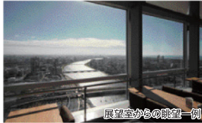
展望室からの眺望一例