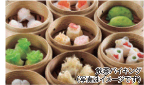
飲茶バイキング (写真はイメージです)

☎11:30~14:00 席100席 現金、カード(ダイナース、JCB、DC、VISA、UC、UFJ、AMEX、銀聯 他) ☎025-240-1941